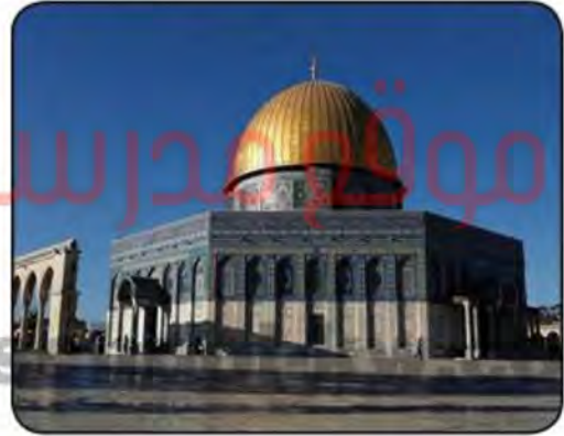
القضية الفلسطينية- المجال السياسي