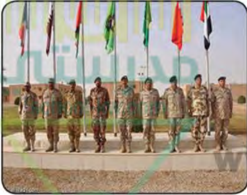
قوة درع الجزيرة - المجال العسكري

شهدت مسيرة منظمة مجلس التعاون الخليجي منذ نشأتها إنجازات كبرى في العديد من المجالات انعكست على المواطن الخليجي مثل إنشاء السوق الخليجية المشتركة وقوة درع الجزيرة العربية، وكذلك على مستوى العالم العربي والإسلامي مثل دعم القضية الفلسطينية. حيث حققت منظمة دول مجلس التعاون الخليجي تطلعات على جميع الأصعدة الاقتصادية والسياسية والاجتماعية والثقافية والتعليمية والرياضية.