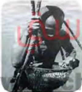
الظهور عن اللؤلؤ