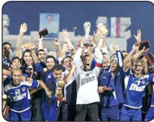
الفرق الرياضية - المجال الرياضي